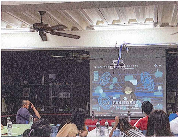
說明：安全健康上網短片欣賞。