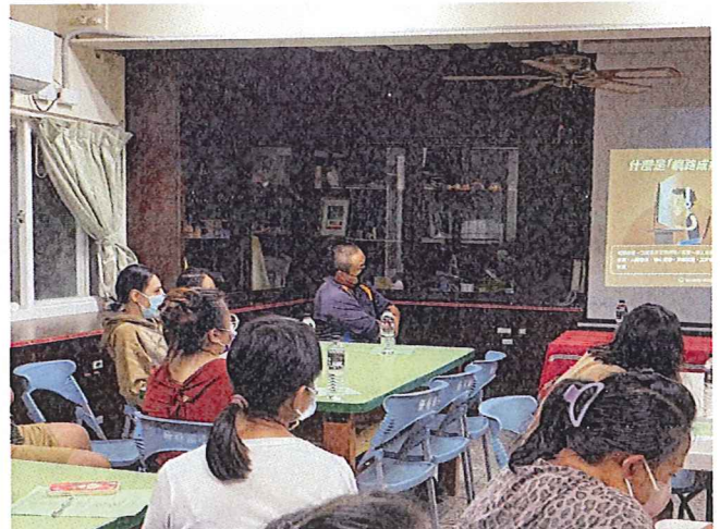
說明：方便的網路，存在許多危險。